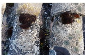
après 30 min.