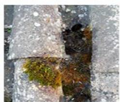
+ 30 min.