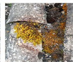
+ 24 h