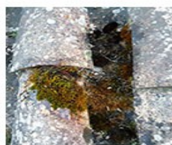
+ 60 min.