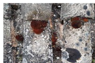
après 24 h